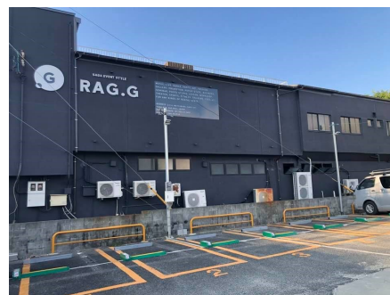
黒つや消しに白文字のRAG-G

このたび施工を思い立たれ、外壁塗装工事をさせて頂くことに。 以前の素材を感じさせる土壁調の色から、蘇鉄の植木に似合うト ロピカル調の色に変更されました。