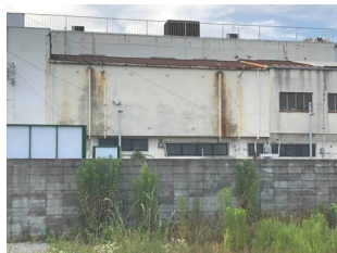
以前は積文館という書店でした