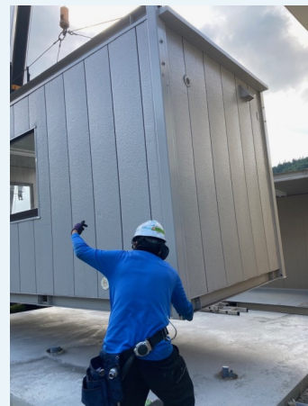
コンテナハウスを設置中