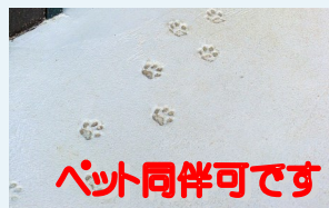
ペット同伴可です