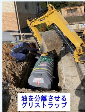
油を分離させる グリストラップ