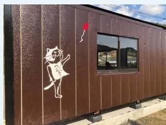
つむぎ食堂のキャラクター