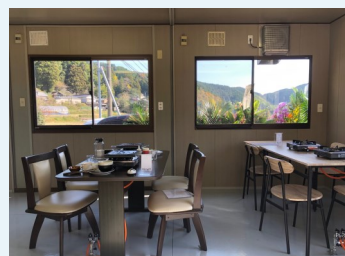
開店後の店内の様子