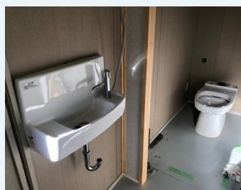
トイレ、手洗い場工事中