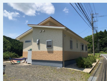
手前は施工前の自宅庭

トイレ工事、換気扇工事、排水管工事、グリストラップ（浄化槽への排水中に含まれる油分を分離させる部品）設置工事（掘削り埋め戻し含む）