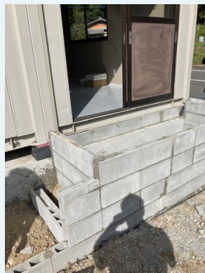
工事中のコンクリート階段