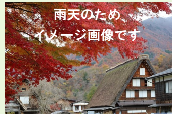
雨天のため、イメージ画像です