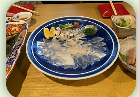
下関名物ふぐ刺しに、舌鼓