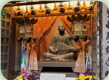
赤間神宮の芳一堂には、怪談で有名な「耳なし芳一」が祀られています