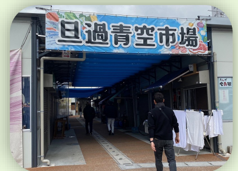
今まで何度か浸水や火災が発生し、再建中の旦過青空市場