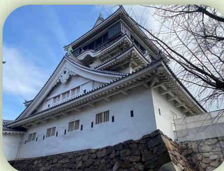
戦国末期に毛利氏に作られ、2019年に天守閣内装をリニューアルした小倉城