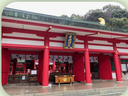
壇ノ浦の戦いで亡くなられた、安徳天皇が祀られている赤間神宮