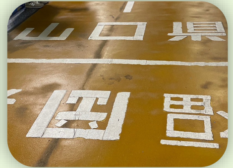
福岡県から山口県へ