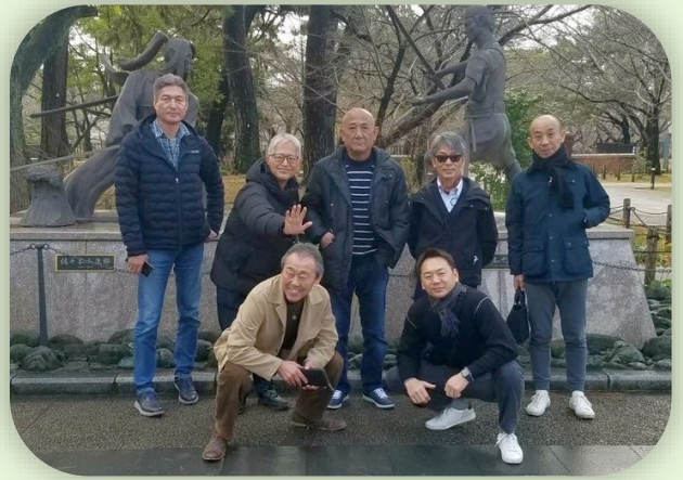
小倉城前にて、大川市塗料商業会の集合写真

下関の快適なホテルに一泊、再び門司レトロ地区により買い物。我が家の犬にも、餌のお土産を買いました。