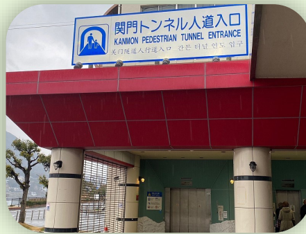
九州から本州まで関門トンネルを歩いて15分